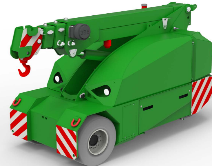
MC 45S (metric) Portata Massima 4.500 kg