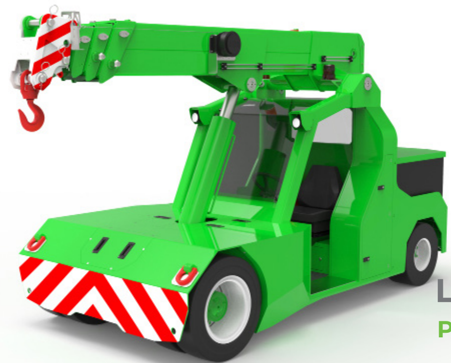
L90 (metric) Portata Massima 9.000 kg